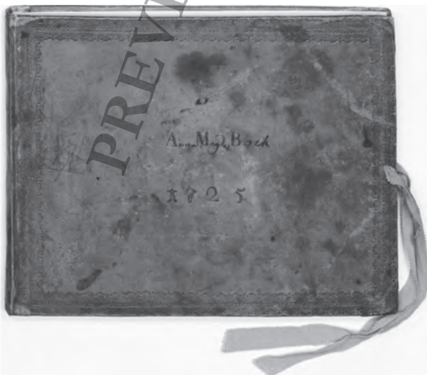
Reproducere facsimil a copertei albumului pentru Anna Magdalena Bach, 1725.